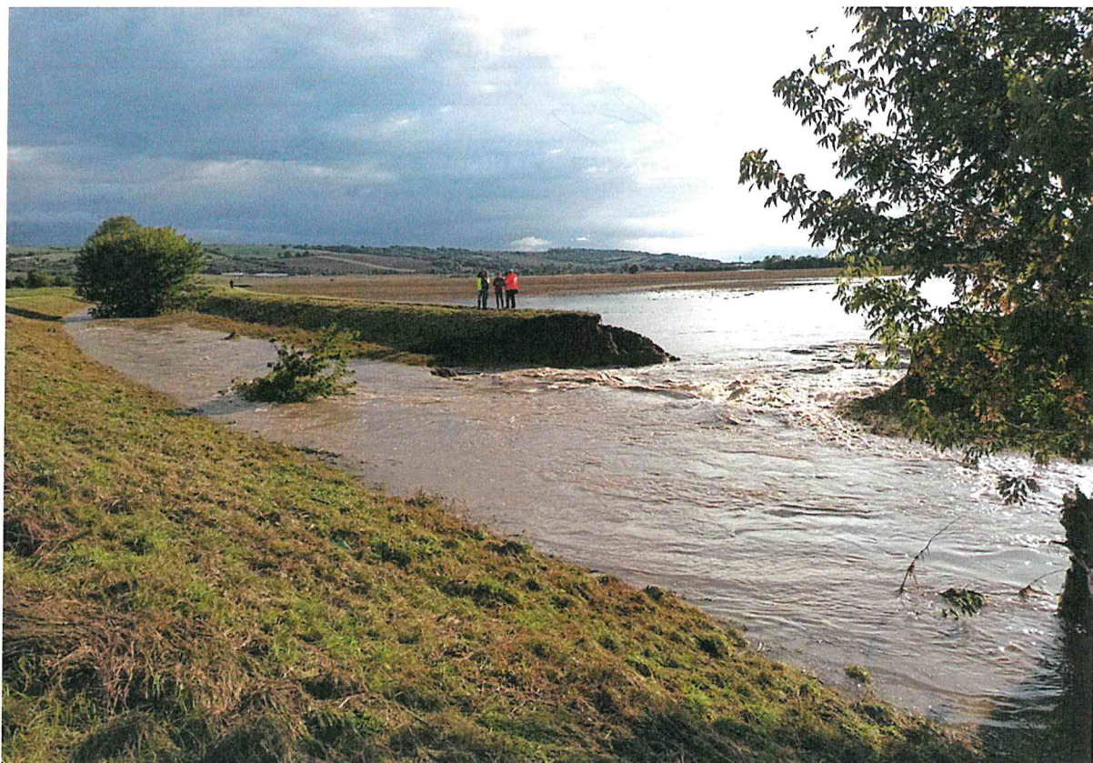
Přelitá koruna hráze, ř. km 4,527-5,087