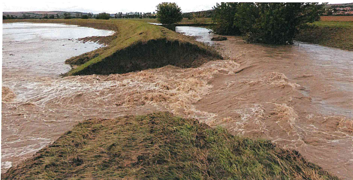
Přelitá a rozplavená hráz, ř. km 4,530